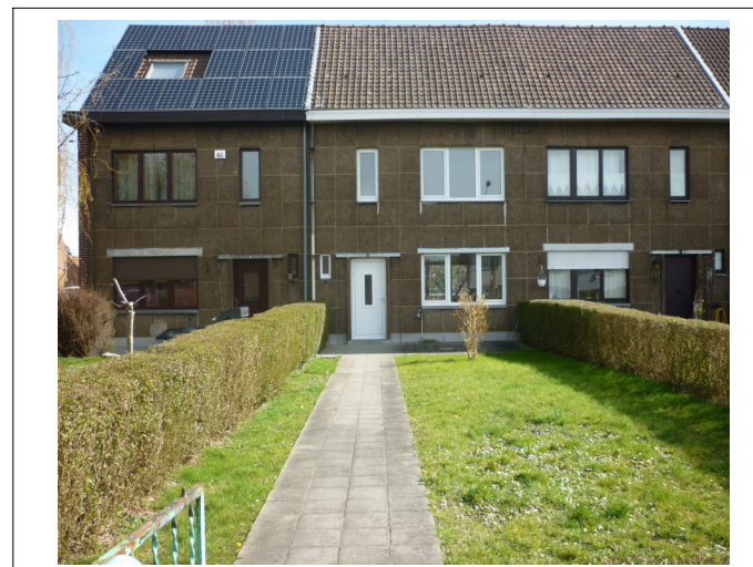
Photo du bien